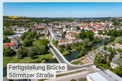
Fertigstellung Brücke Sörmitzer Straße