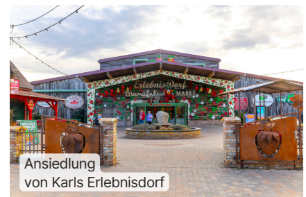
Ansielung von Karls ErlebnisDorf