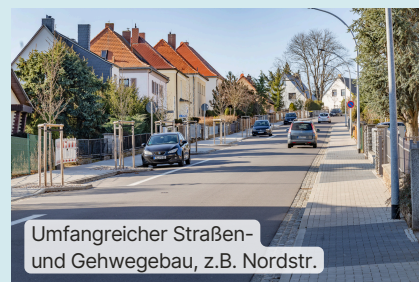
Umfangreicher Straßen- und Gehwegbau, z.B. Nordstr.