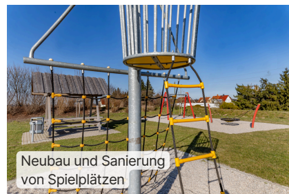
Neubau und Sanierung von Spielplätzen