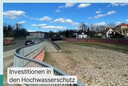
Investitionen in den Hochwasserschutz