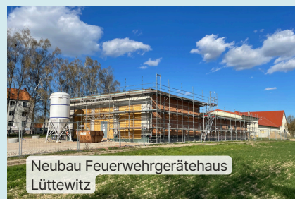
Neubau Feuerwehrgerätehaus Lüttewitz