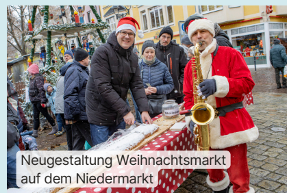
Neugestaltung Weihnachtsmarkt auf dem Niedermarkt