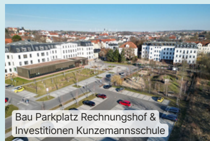
Bau Parkplatz Rechnungshof & Investitionen Kunzemannsschule