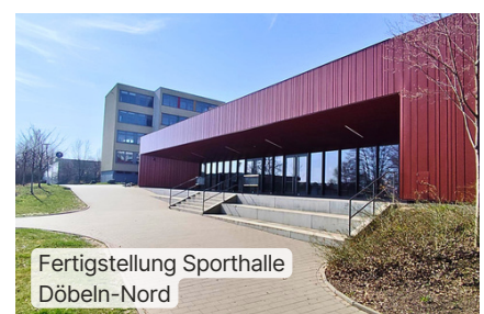
Fertigstellung Sporthalle Döbeln-Nord