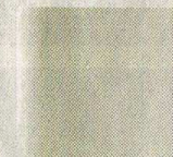
Torsten Boin parteilos